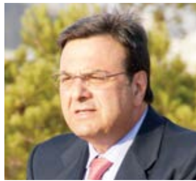
ΙΣΙΔΩΡΟΣ ΚΟΥΒΕΛΟΣ - Πρόεδρος Διεθνούς Ολυμπιακής Ακαδημίας

Το Βιωματικό και Εκπαιδευτικό πρόγραμμα IMAGINE PEACE JUNIORS CAMP, προσφέρει τη μοναδική ευκαιρία σε παιδιά & εφήβους να βιώσουν και να κατανοήσουν την έννοια του